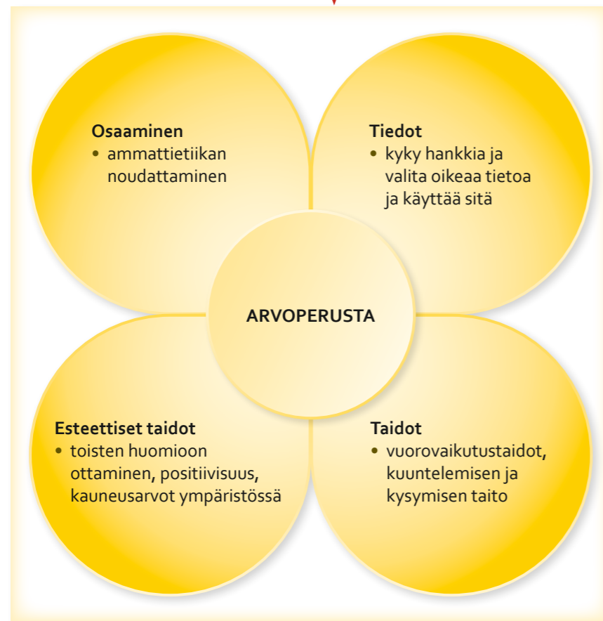
Kuvio 3. Arvoperustan muodostuminen.

Kuviot havainnollistavat ja selkiyttävät keskeisiä sisältöjä.