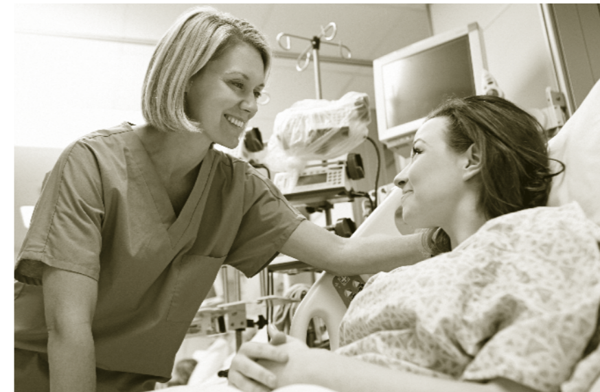
Ammatti-identiteetti näkyy kauniina käytöksenä.

Lähihoitaja tarvitsee etiikkaa välineekseen, koska hän joutuu käyttämään omaa persoonaansa työvälineenä ja pohtimaan oman arvomaailmansa suhdetta oman ammattialansa arvioihin. Näin lähihoitajalle kehittyy ammatti-identiteetti , jonka varassa hänen on hyvä tehdä työtänsä. Hyvä ammattieettinen toiminta näkyy niin kauniina käytöksenä kuin sovitujen toimintakäytäntöjen noudattamisenakin.